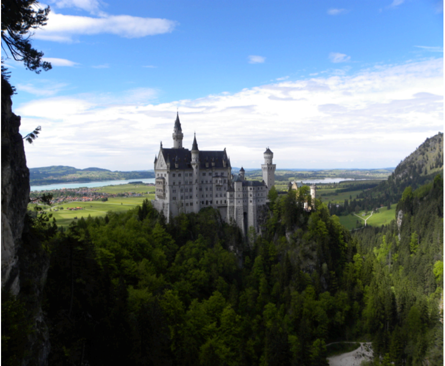
Schloss Neuschwanstein by Thomas Pospiech '14