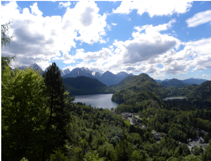
Die Bayerischen Alpen, der Alpsee, der Schwansee und Schloss Hohenschwangau